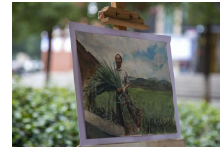
彩绘美丽文化墙 为美丽乡村添彩术学部

( : )九 , 儿 依 分 为 三 : 全 互 关 , 份 中 、 云 、 依 , 依 , 依 。 亲 、 、 、 个 体 上 。 但 中 人 一 个 具 依 上 , , 会 依 个 体 人 三 . 了 上 , 了 、 内 人 、 作 具 们 一 切 事 , 中 。 , 人 也 予 不 作 。 们 何 个 世 , 何 与 人 们 一 : , 乡 一 . 于 个 体 全 。 , 何 , , 不 。 为 , 个 体 一 个 于 。 今 , 、 习 俗 , 全 , 人 、 内 中 , 什 。 但 人 们 中 、 其 他 主 全 么 , 什 , 人 , 具 , 以 人 会 与 人 交 , 会 一 。 全 一 分 人 。 上 , 从 一 “ 全 决 了 中 作 为 一 信 仰 , ”, “ 人 ” 与 依 之 以 为 “ ” 、 一 依 。 为 人 健 。 “ ” 为 人 佳 , 们 不 人 , “ ” 不 仅 中 , 全 。 与 亲 人 , 但 们 以 三 以 人 。 二 . 个 体 五 一 上 、 分 享 , 个 体 与 。 依 , 儿 与 养 之 不 ; 一 从 依 不 供 , 一 , 一 个 与 , 先 从 儿 会 依 , 互 , 别 中 。 , 了 。 人